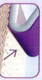
No skin stripping occurs with Safetac