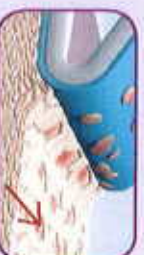
Skin stripping occurs with traditional adhesive

Safetac® technology. Less trauma. Less pain.™ Safetac is a patented soft silicone adhesive technology. Dressings with Safetac technology are atraumatic both during wear and upon removal. These dressings minimize trauma to the wound and the surrounding skin, which minimizes pain to the patient. They also prevent maceration by sealing around the margin of the wound to protect peri-wound skin.