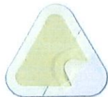
Askina® Transorbent Sacrum Apósito hidrocelular con reborde adhesivo para la zona sacra