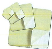
Askina® Transorbent Apósito hidrocelular adhesivo