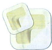
Askina® Transorbent Border Apósito hidrocelular con reborde adhesivo